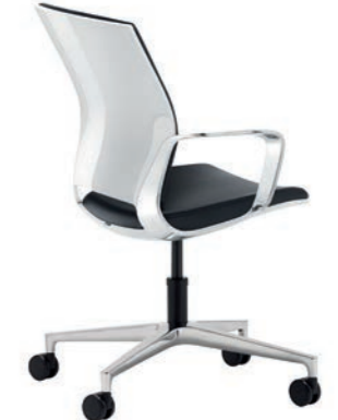
Corporate Konferenz-Drehsessel, mit Rollen, Rücken Weiss Hochglanz