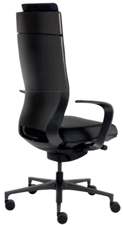
Corporate Bürodrehstuhl mit Kopfstütze, Rücken Quarzmetallic Seidenmatt