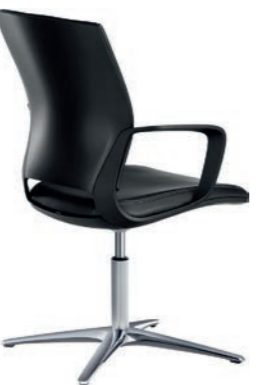
Corporate Konferenz-Drehsessel, Rücken Schwarz Matt