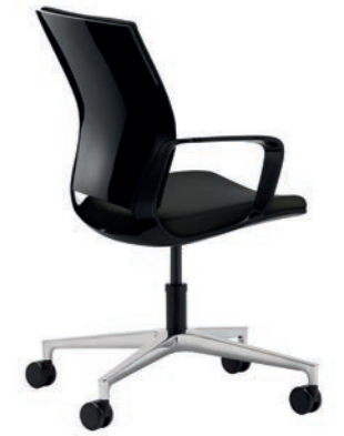
Corporate Konferenz-Drehsessel, mit Rollen, Rücken Schwarz Hochglanz