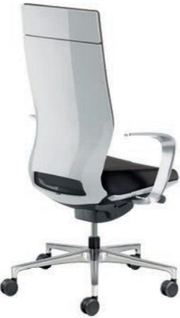
Corporate Bürodrehstuhl ohne Kopfstütze, Rücken Weiss Hochglanz