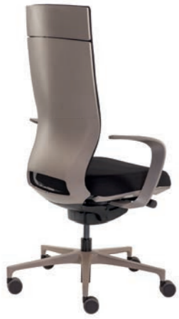
Corporate Bürodrehstuhl ohne Kopfstütze, Rücken Cubanit Seidenmatt