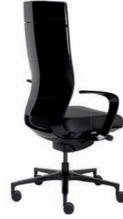
Corporate Bürodrehstuhl ohne Kopfstütze, Rücken Schwarz Hochglanz