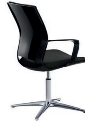
Corporate Konferenz-Drehsessel, Rücken Schwarz Hochglanz