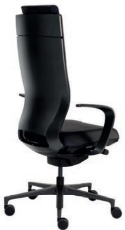
Corporate Bürodrehstuhl mit Kopfstütze, Rücken Schwarz Matt