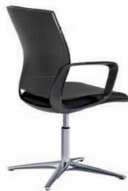
Corporate Konferenz-Drehsessel, Rücken Quarzmetallic Seidenmatt