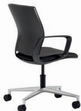
Corporate Konferenz-Drehsessel, mit Rollen, Rücken Quarzmetallic Seidenmatt