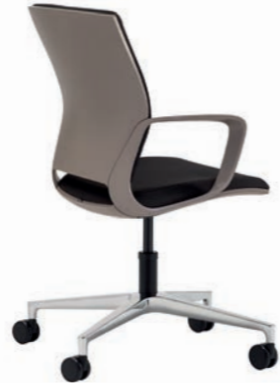
Corporate Konferenz-Drehsessel, mit Rollen, Rücken Cubanit Seidenmatt