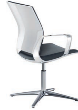
Corporate Konferenz-Drehsessel, Rücken Weiss Hochglanz