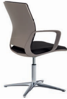
Corporate Konferenz-Drehsessel, Rücken Cubanit Seidenmatt