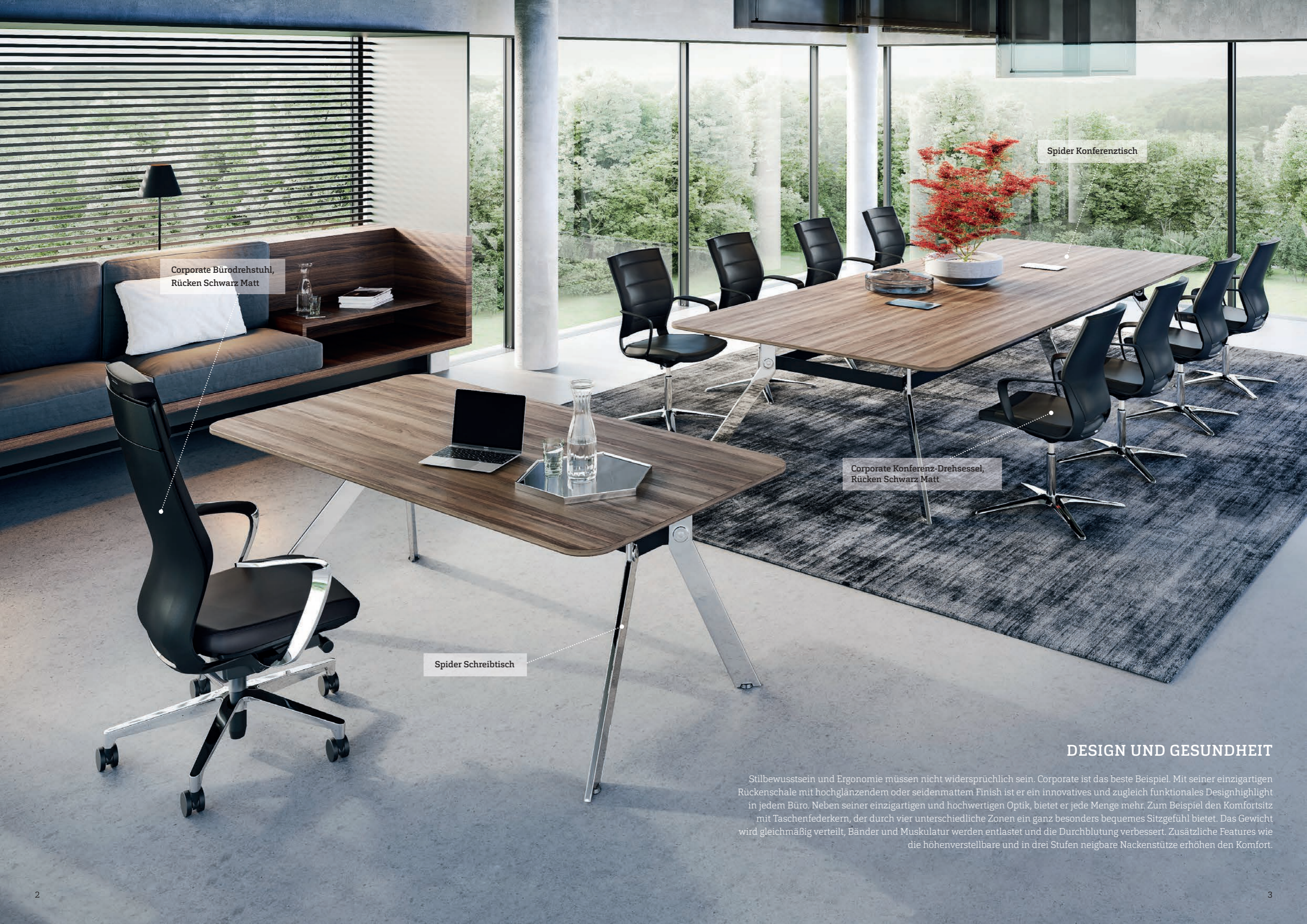
Corporate Bürodrehstuhl, Rücken Schwarz Matt