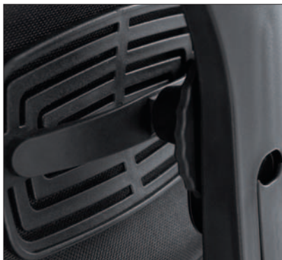
Höhenverstellbar und tiefenverstellbar