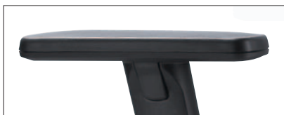
Typ R16/1: höhen- und breitenverstellbar, Softpad