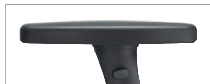
Typ R16/5/6: 4-D Armlehne, Softpad